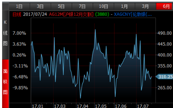
图 4、沪银 12 月-伦敦银（RMB/kg）溢价近期宽幅波动