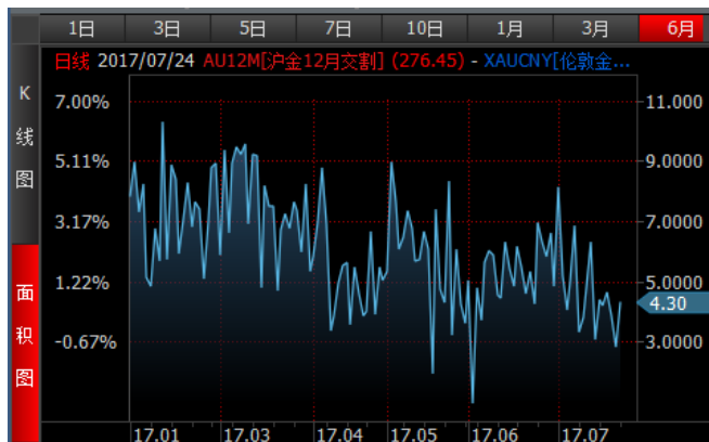
图 3、沪金 12 月-伦敦金（RMB/g）溢价近期低位震荡